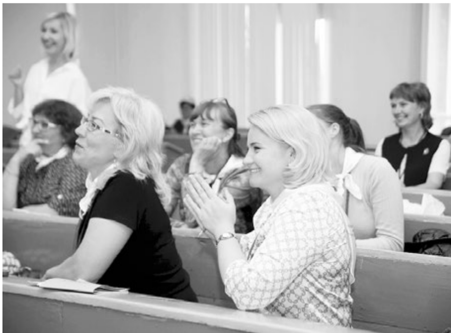
На фестивале не было ни одного скучного мастер-класса

Трудно назвать аспект школьной жизни, которому бы не было уделено внимание на